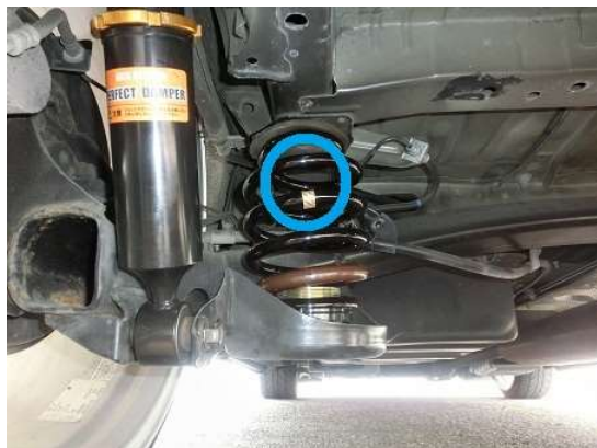
車両後方から見た状態