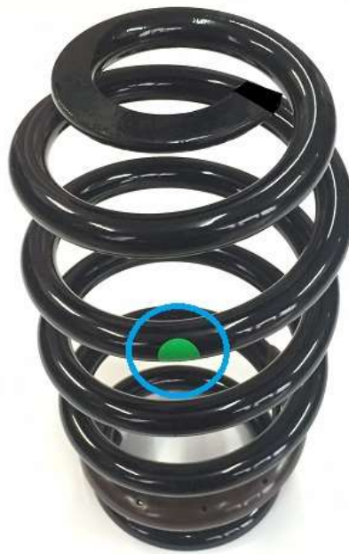
スプリングを上から見た状態