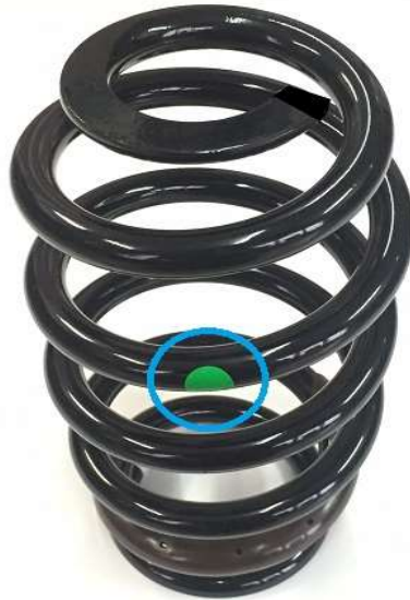
スプリングを上から見た状態