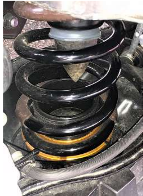
アジャスターはスプリング下側に装着

アジャスター底面にゴムシートを貼りつけているので純正スプリング下部に付いていた純正ゴムシートは使用しません