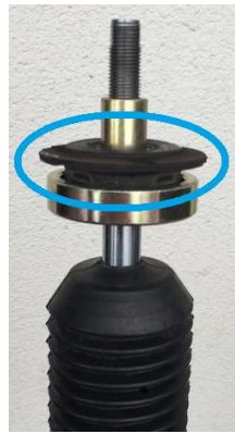
⑤純正ゴムブッシュ装着図